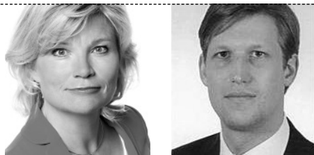
Autoren: Dr. Ute Jasper und Jens Bie-mann, Heuking Kühn Lüer Wojtek, Düsseldorf

Mit der Entscheidung des Europäischen Gerichtshofes (EuGH) kam für viele Kommunen die langersehnte Erleichterung: Sie müssen ihre Grundstücksverkäufe nicht mehr europaweit ausschreiben. Damit darf eine Kommune wieder ohne Ausschreibung Investoren für ihre Grundstücke suchen.