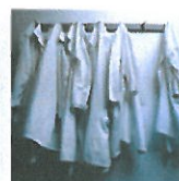
Beratung bei der Wahl ärztlicher Kooperations- und Rechtsformen