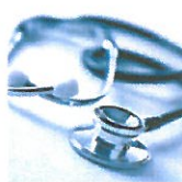
Arbeitsrecht in der Arztpraxis