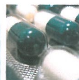
Aznen- und Heilmittelrecht