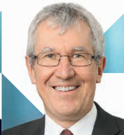
Norbert Portz, Deutscher Städte- und Gemeindebund