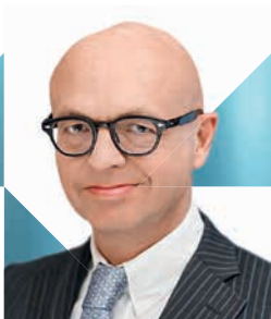
VORSITZ | 23. JUNI 2020

Beteiligen Sie sich aktiv am vergaberechtlichen Diskurs und knüpfen Sie am 15. Deutschen Vergaberechtstag wertvolle neue Kontakte.