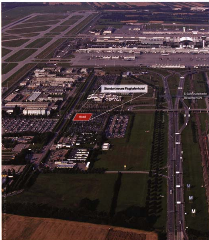
Am Flughafen München wird derzeit viel gebaut, nicht nur auf Erbbaurechtsgelände.