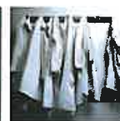
Beratung bei der Wahl ärztlicher Kooperations- und Rechtsformen