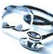
Arbeitsrecht in der Arztpraxis