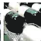
Arznei- und Heilmittelrecht